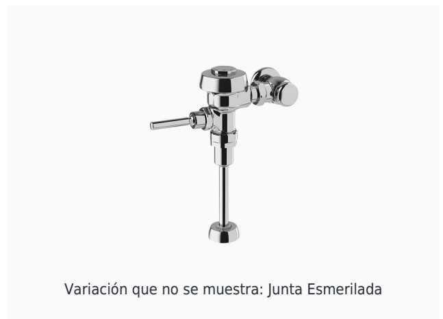
Variación que no se muestra: Junta Esmerilada